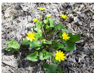
Рис. 1. Название рисунка – 12 кегль